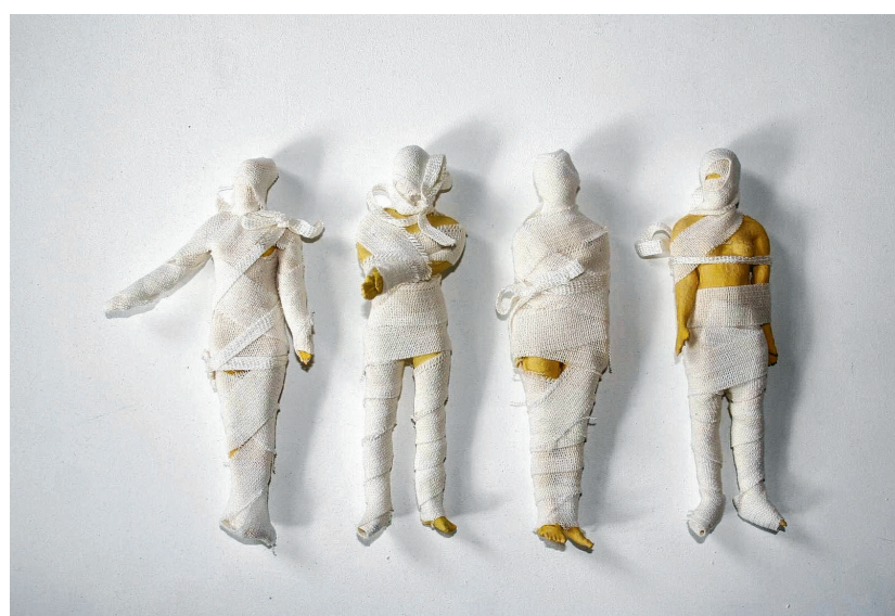
Le jeu des nains jaunes I, 2008.